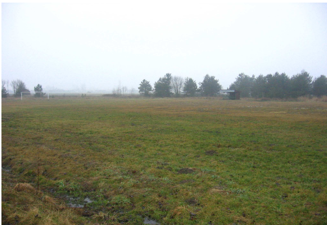
Fot. 3. Teren na tzw. Cegielni pod planowaną budowę boiska sportowego

Poniżej zamieszczono zdjęcia przedstawiające teren planowanych inwestycji.