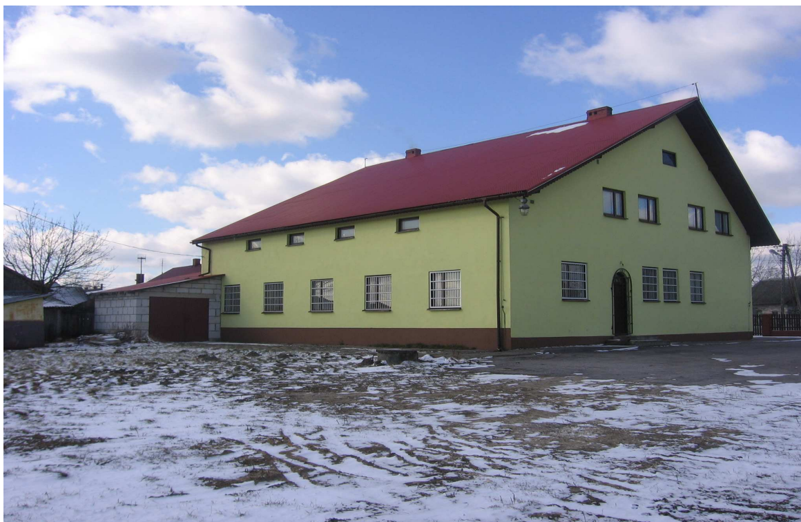
Fot. 2. Strażnica OSP – teren do zagospodarowania