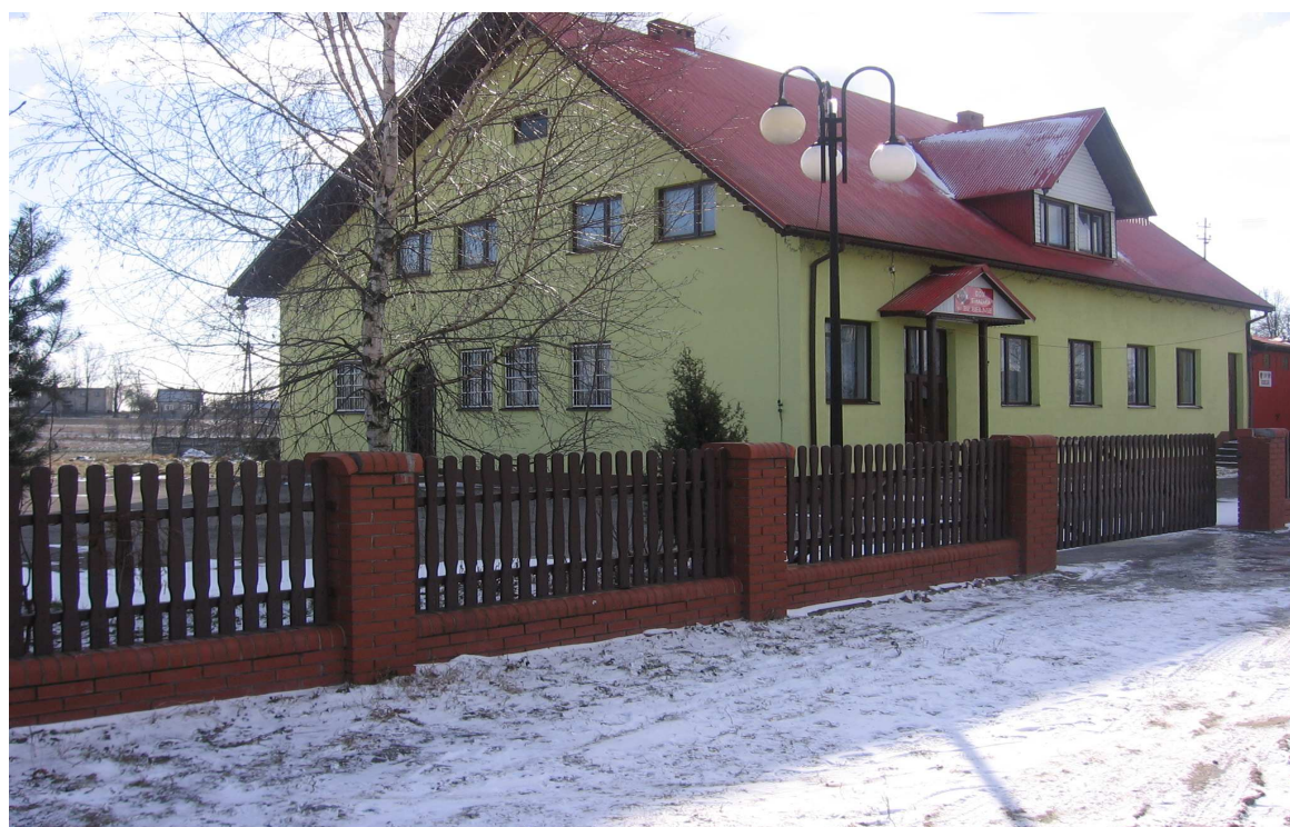
Fot. 1. Dom Strażaka